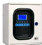
INTEGRATEUR MINI CK 101 F